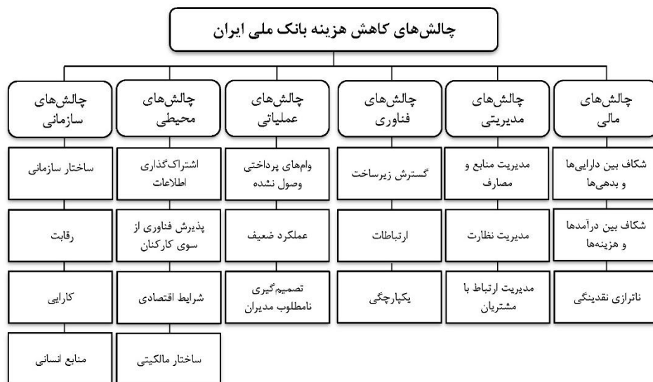
شکل ۲. ساختار سلسله مراتبی چالش‌های کاهش هزینه بانک ملی ایران

از معیارها را در راستای گزینه‌های رقیب جهت رتبه‌بندی آن‌ها مشخص می‌سازد. روش FAHP به‌گونه‌ای ماتریس‌های حاصل از مقایسات را با یکدیگر تلفیق می‌کند که تصمیم بهینه حاصل آید (آذر و فرجی، ۱۳۹۵). مراحل روش FAHP شامل ترسیم درخت سلسله مراتبی، تشکیل ماتریس‌های توافقی قضاوت، محاسبه وزن‌های اولیه، تعیین وزن نرمالیزه شده ماتریس‌ها و محاسبه اوزان نهایی است (زنجیرچی، ۱۳۹۰). ساختار سلسله مراتبی چالش‌های کاهش هزینه از دیدگاه مدیران و خبرگان بانک ملی ایران نیز در شکل ۲ آورده شده که با استفاده از سطوح هدف، معیار و زیرمعیارها ترسیم شده است. سپس با نظرسنجی از مدیران و خبرگان بانک برای هرکدام از این اجزا اعم از معیار و زیرمعیارها با استفاده از مقایسات زوجی، وزن‌دهی انجام می‌شود. پس از ترسیم درخت سلسله مراتبی، با استفاده از مجموعه‌ای از ماتریس‌ها، معیار یا زیرمعیار هر سطح نسبت به معیار یا زیرمعیار مربوط به خود در سطوح بالاتر به‌صورت دوجه‌دو (زوجی) و با بهره‌گیری از اعداد فازی مثلثی جهت تعیین اهمیت و ارجحیت بین دو عنصر تصمیم بر مبنای نظرات تصمیم‌گیرندگان (مدیران و خبرگان بانک)، ماتریس مقایسات زوجی تشکیل می‌شود. سپس میزان سازگاری و یا عدم سازگاری ماتریس مقایسات زوجی محاسبه و در صورت سازگاری ماتریس مقایسات زوجی، وزن نهایی معیارها و زیرمعیارها تعیین می‌شود.