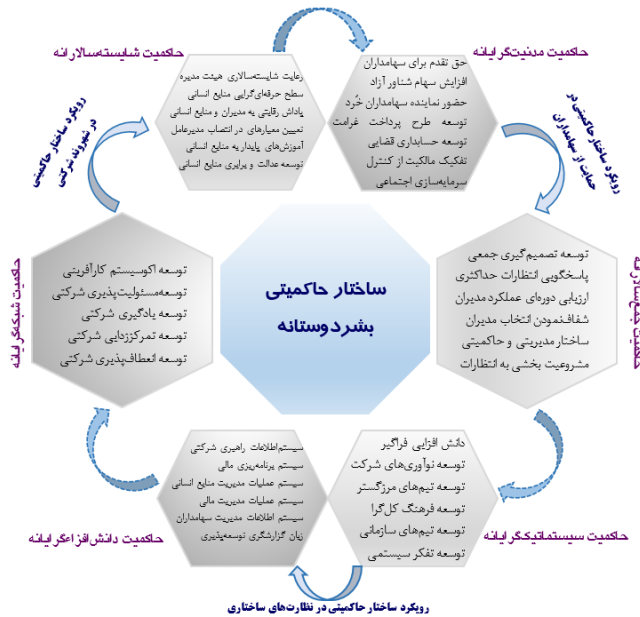
شکل ۶. چارچوب زمینه‌های ساختاری حاکمیت بشردوستانه

پس از تشریح فرآیند تحلیل تم، در گام آخر طبق چارچوب نظری شکل (۶) نسبت به ارائه‌ی ابعاد ساختار حاکمیت بشردوستانه اقدام شد.