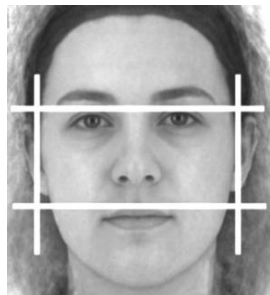
شکل ۱: نحوه‌ی اندازه‌گیری شاخص هورمون تستوسترون

از آنجایی که به‌طور معمول در سازمان‌ها مدیران اجرایی خودشیفته پاداش‌های بیش‌تری برای خود قائل شده و از این طریق موقعیت خود را در سازمان مستحکم می‌کنند (آریلی و همکاران، ۲۰۱۴)، شاخص پاداش نقدی مدیران نیز از تقسیم پاداش نقدی مصوب در جلسه‌ی مجمع عمومی بر کل حقوق و دستمزد پرداختی سال مالی شرکت به دست خواهد آمد.