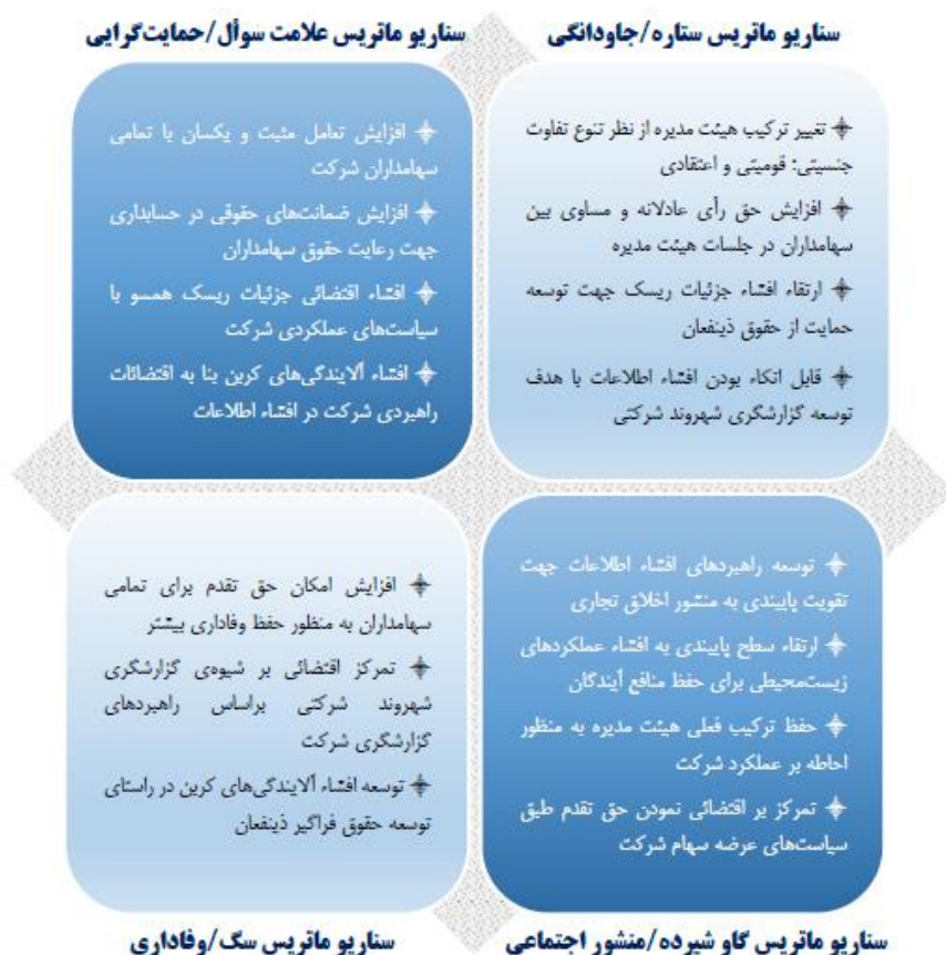
شکل ۳. ماتریس‌های توسعه حسابداری حقوق بشر در ایران

همانطور که مشاهده می‌شود ۴ سناریو محتمل برای توسعه حسابداری حقوق بشر در سطح شرکت‌های بازار سرمایه ایران وجود دارد که به تفکیک نسبت به تشریح این سناریوها اقدام می‌شود. کامل‌ترین سناریو در توسعه حسابداری حقوق بشر در ایران، ماتریس ستاره یا جاودانگی است که به دلیل تقاطع استحکام حاکمیت شرکتی با اعتمادی اجتماعی ذینفعان، رویکردی آرمانگرایانه شناخته می‌شود که چه به لحاظ هنجاری و چه به لحاظ قواعد بازار سرمایه، حاکمیت شرکتی با ایجاد ترکیب متنوعی از عقاید مذهبی؛ جنسیتی و قومیتی، پیشرو ارتقاء اعتماد اجتماعی باشد. براساس ماتریس علامت سوال یا حمایت‌گرایی که در نگاره (۱۱) و شکل (۳) ارائه شده است،