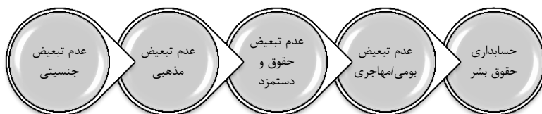
شکل ۱. ابعاد رعایت حقوق بشر در حسابداری

در واقع گری (۲۰۱۳) طیفی از اثرگذاری حسابداری در کارکردهای درون ساختاری شرکت‌ها را مدنظر قرار داد تا وجود چنین سیاست‌های کارکردی در جریان عملکردهای مالی شرکت‌ها بتواند، به ایجاد عدالت و برابری برای سرمایه‌گذاران متنوع و متفاوت به لحاظ تفاوت‌های آیینی، اعتقادی، بومی و فرهنگی منجر شود (مک‌فایل و همکاران ۲۰ ، ۲۰۱۴). به عنوان مثال عدالت و برابری در ارتقاء حرفه‌ای حسابداران چه به لحاظ جنسیتی و چه به لحاظ فرهنگی از منظر ابعاد هافستد، را می‌توان مبنایی برای عدم تبعیض بین سرمایه‌گذاران در افشاء اطلاعات تلقی نمود. به علاوه وسعت سرمایه‌گذاران به دلیل تفاوت رویکردها می‌تواند عامل دیگری برای توسعه حسابداری حقوق بشر تلقی گردد. وجود قوانین و مقررات در مورد مهاجران یا اقلیت‌های اجتماعی؛ مذهبی و جنسیتی نیز از جمله عوامل دیگری است که می‌تواند دلیلی برای توسعه حسابداری در حقوق بشر تلقی گردد. در بازار سرمایه ایران نیز به دلیل وجود شکاف بین توصیه‌ی نهادهای بین‌المللی در مورد حقوق بشر با الزامات؛ قوانین و هنجارها نیز می‌تواند مبنایی برای بررسی موضوع حسابداری حقوق بشر محسوب شود. همچنین وجود مهاجران غیرقانونی و عدم تأیید هویت آنان و یا عدم پذیرش حسابداران فرا جنسیتی و یا مذاهب متفاوت از شرع، می‌تواند از جمله مبنایی پنهان در موضوع حسابداری حقوق بشر در ایران تلقی گردد (آستون، ۲۰۱۹).