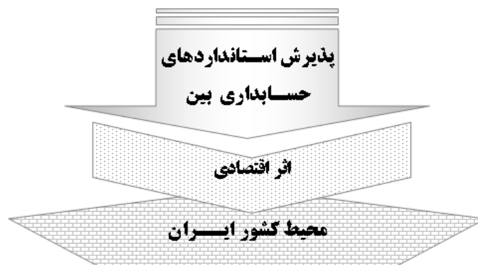
شکل ۱: ارتباط میان متغیرهای پژوهش

در پژوهش حاضر تأثیر پذیرش استانداردهای حسابداری بین‌المللی به عنوان متغیر مستقل بر بعد اقتصادی محیط ایران، به عنوان متغیر وابسته مورد تجزیه و تحلیل و بحث قرار گرفته است. ارتباط میان متغیرهای این پژوهش در شکل ۱ نشان داده می‌شود: