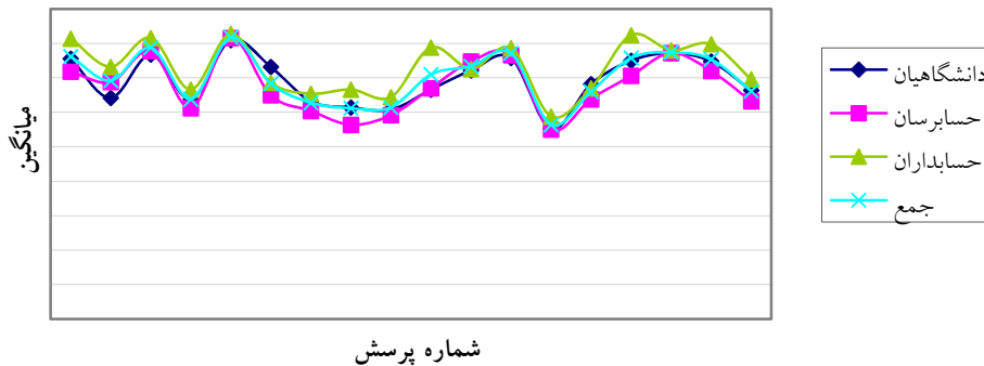
شکل (۲): میانگین پرسش‌های بعد اقتصادی از نظر گروه‌های پرسش شونده